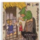
dulj) Bei der Hexe