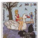
dumj) Glückliches Ende