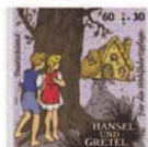
dukj) Die Kinder im Wald

2014, 6. Febr. Wohlfahrt: Grimms Märchen – Hänsel und Gretel. Grah und Menze; Odr. BDB (Klb. 5x2); gez. S 13%.